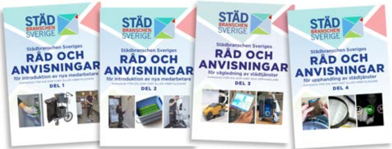
Råd & Anvisningar, del 1, del 2, del 3, och del 4