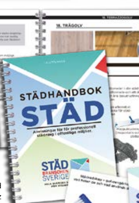
Städhandbok Städ med ett quiz